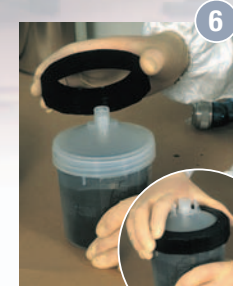
6 Befestigung des Verschlussrings auf dem Becher.