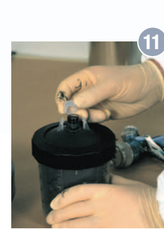
11 Zum Aufbewahren von Lackresten einfach die mitgelieferte Verschlusskappe auf dem Deckel befestigen, aus dem Becher nehmen und ins Regal stellen.