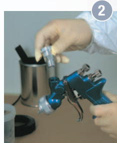
2 Lacksieb aus der Pistole entfernen. Befestigen des geeigneten Adapters auf der Pistole mit Teflonband.