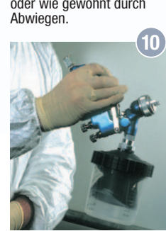
10 Pistole von der Druckluft abkoppeln. „Über Kopf“ den Abzug durchziehen und den Beutel entspannen.