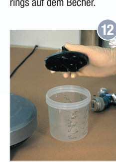
12 Nach Beendigung des Lackiervorgangs kann der leere, zusammengezogene Beutel samt Deckel in der „Rethmann-Tonne“ entsorgt werden.