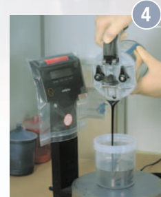
4 Ablesen der Farbmenge auf der Becherskalierung, oder wie gewohnt durch Abwiegen.