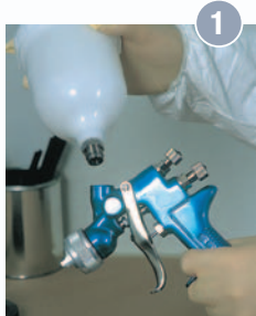
1 Entfernen des vorhandenen Bechers von der Pistole.