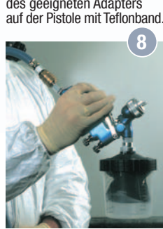
8 Pistole an die Druckluftzufuhr anschließen, Pistole um 180 C° drehen und den Abzug durchziehen, um ein Vakuum zu erzeugen.