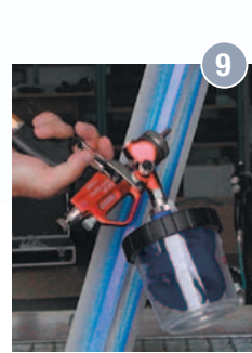
9 Lackieren in jeder Position, auch „Über-Kopf“, möglich.