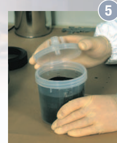
5 Verschließen des Bechers mit dem PPS-Filterdeckel.