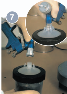
7 Pistole „kopfüber“ per Bajonetverschluss bis zum fühlbaren Einrasten auf dem Becher befestigen.