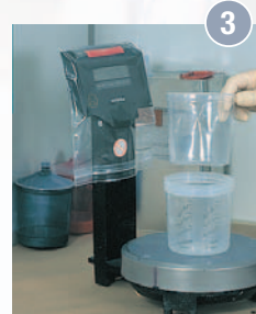
3 Einsetzen des Beutels in den PPS-Becher.